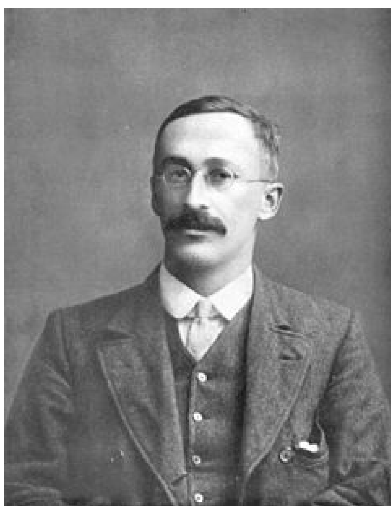
Imagem 1: William Selay Gosset

Em 1899, com 23 anos, ele foi trabalhar na cervejaria de Arthur Guinness e Cia Ltda. de Dublin, Irlanda. Ele permaneceu nesse emprego por toda a vida e chegou ao topo da indústria cervejeira como cervejeiro mestre da Guinness em uma nova cervejaria em Londres.