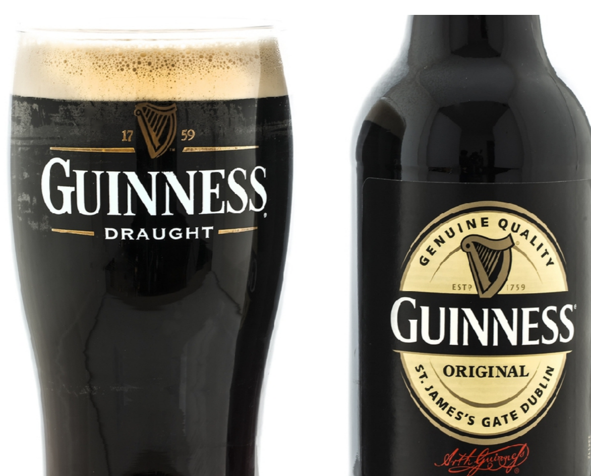
Imagem 2: Cerveja Guinness.

A cervejaria irlandesa foi fundada, em 1759, por Arthur Guinness (1725 - 1803) e está localizada no lado sul do rio Liffey e no lado oeste da cidade próxima a passagem St. James, que já não existe mais. A Guinness é a maior cervejaria da Irlanda e foi por um bom tempo a maior do planeta e sua cerveja preta amarga é popular em todo o mundo. A empresa ficou mundialmente conhecida pela publicação do livro dos Recordes Mundiais (The Guinness Book of Records) em 1955.