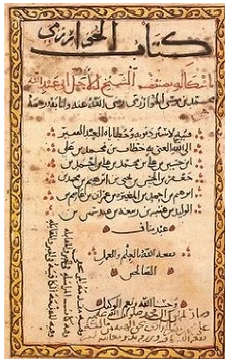
Figura 4: Uma página da álgebra de al-Khwarizmi

Uma segunda obra fundamental de al-Khwarizmi foi o Tratado sobre o Cálculo da al-Jabr e al-Muqabalah. Esse livro é considerado o fundador da álgebra como área do conhecimento matemático, sendo a palavra álgebra uma evolução do termo al-jabr. Nessa obra, al-Khwarizmi discorreu sobre soluções de equações de primeiro e segundo graus, tratadas de forma puramente retórica.