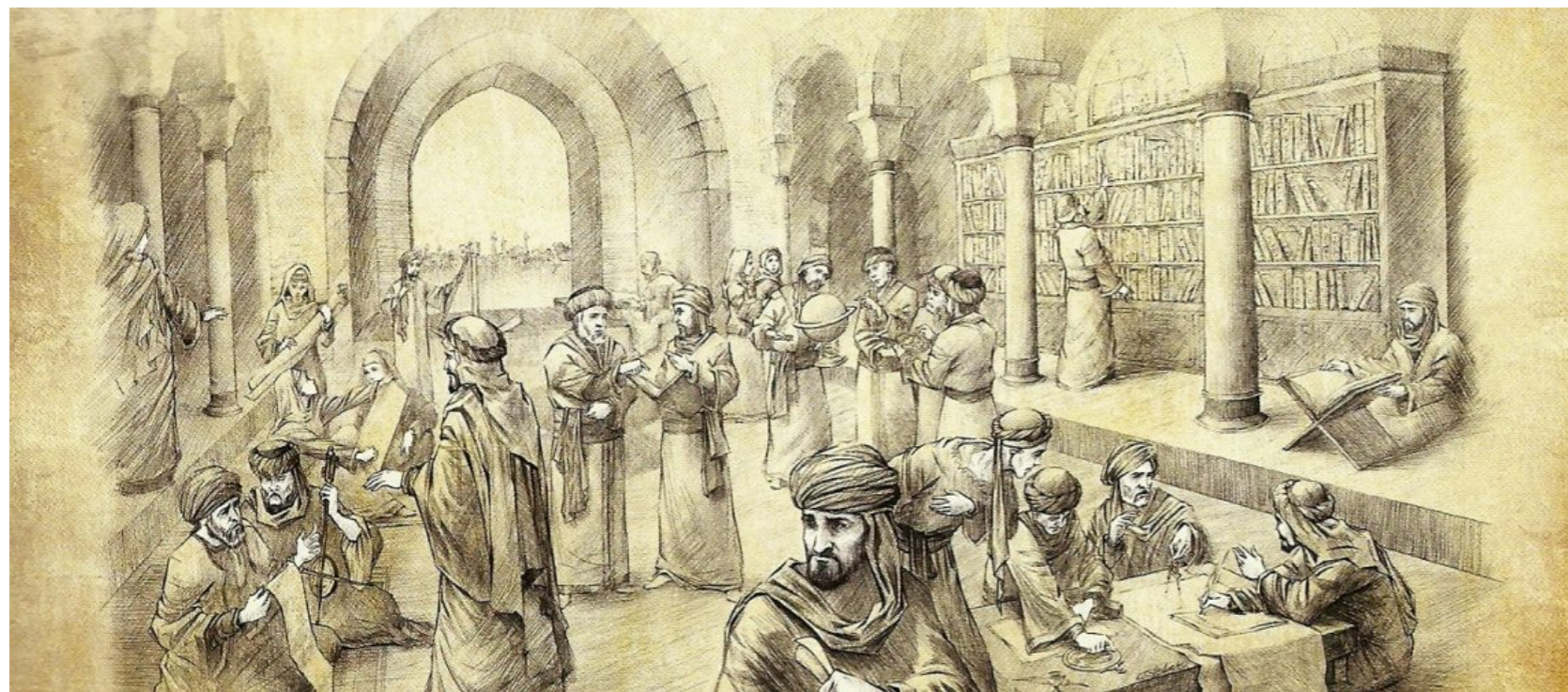
Figura 1: Casa da Sabedoria

Nesse contexto, a cidade de Bagdá foi construída pelo califa Abu Jafar al-Mansur (714-775) para substituir Damasco como capital da porção oriental do Império Árabe. Al-Mansur era um homem interessado em filosofia e ciência e procurou criar condições em sua nova cidade para o estudo e a produção científica. Fundou uma biblioteca em seu palácio, que inicialmente se ocupou de traduções para o árabe de textos persas, hindus e gregos. Essa biblioteca ficaria conhecida como Casa da Sabedoria ( Bait al-Hikma ) e, mais tarde, evoluiria para uma instituição de ensino e pesquisa, destacando-se como um dos mais importantes centros de produção científica no período compreendido entre os séculos IX e XIII.