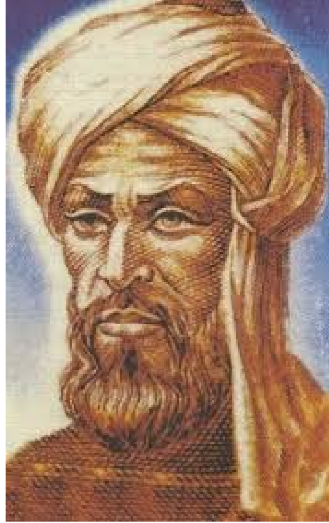
Figura 3: Foto de al-Khwarizmi. Essa imagem foi impressa em um selo russo

Muhammad ibn Musa al-Khwarizmi nasceu por volta do ano 780. Os historiadores acreditam que ou ele, ou seus ascendentes tenham vindo de Khwarezm, uma região da Ásia central que agora faz parte do Turcomenistão e do Uzbequistão.