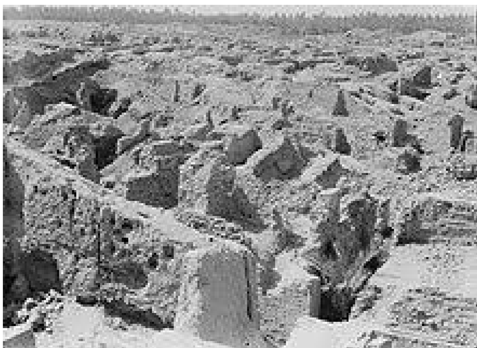
Figura 2: Casa da Sabedoria - situação atual

Dois eventos marcaram o declínio árabe: a conquista de Córdoba (Espanha), capital do ocidente muçulmano, em 1236, e a destruição de Bagdá, capital do oriente muçulmano, pelos mongóis em 1258.